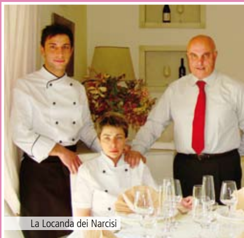
La Locanda dei Narcisi