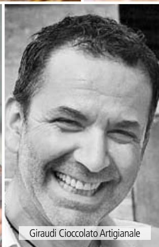
Giraudi Cioccolato Artigianale